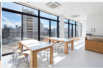
88,600円/月～ 東京 / 渋谷 徒歩6分 マスタードホテル渋谷

※ホテルの価格は2022年9月時点のものです。変動する可能性がありますのでご了承下さい。